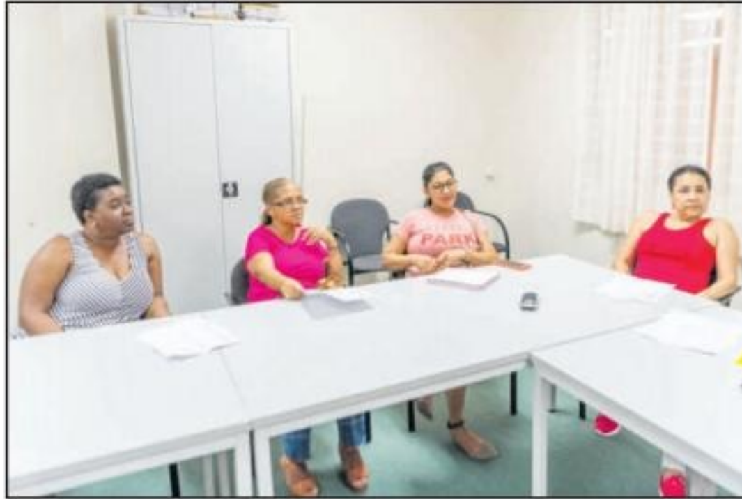
steentje bij y a haci cu e evento tabata uno exi-

Despues di e evento Best of the Best Test Event e directiva a keda contento con tur cos a bay, pasobra tur hende a draag een